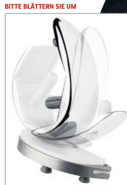
Die KNIE-SCHLITTEN-PROTHESE (u. a. aus Cobalt-Chrom und Titan) ist rund 4 Zentimeter hoch und breit

Wie wird ein neues Gelenk eingebaut? BITTE BLÄTTERN SIE UM