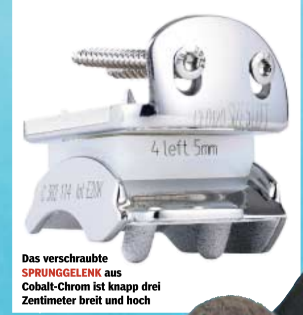
Das verschraubte SPRUNGGELENK aus Cobalt-Chrom ist knapp drei Zentimeter breit und hoch