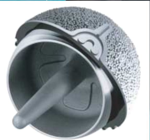
Der HÜFT-OBERFLÄCHEN-ERSATZ hat einen Durchmesser von 4,4 bis 6,4 Zentimeter, besteht aus Titan-Cobalt-Chrom