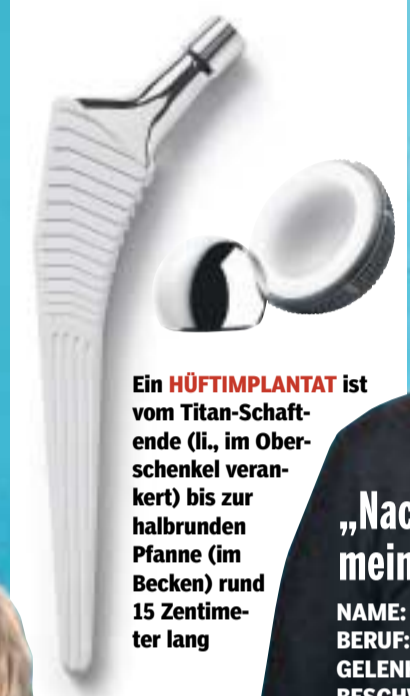
Ein HÜFTIMPLANTAT ist vom Titan-Schaftende (li., im Oberschenkel verankert) bis zur halbrunden Pfanne (im Becken) rund 15 Zentimeter lang